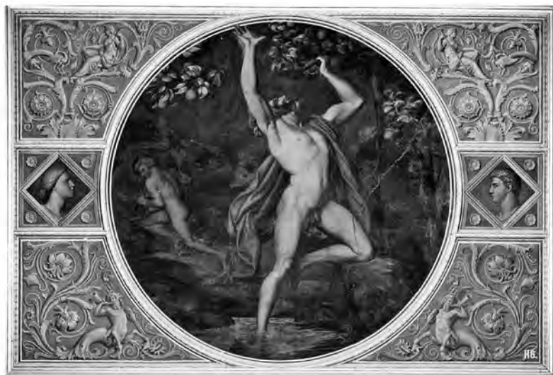
Blestemul lui Tantal – a tânji veșnic după ceva 2